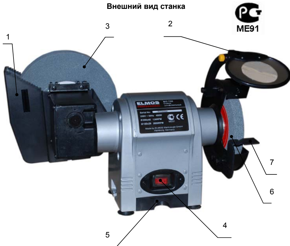
Внешний вид станка